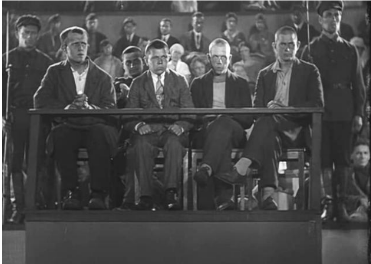
Фрагмент фильма 1930 г. «Суд должен продолжаться» (реж. Ефим Дзиган, Борис Шрайбер)

насильников. С помощью Нелюбшиса Б-вой удалось дойти до ближайшего милиционера и заявить о случившемся». (Из обвинительного заключения к материалам судебного дела). 2